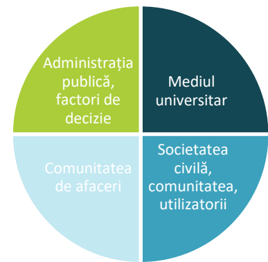
FIGURA 1 MODELUL CVADRUPLU HELIX

În ceea ce privește actorii relevanți în dezvoltarea unui teritoriu, modelul de cvadruplu helix oferă baza teoretică pentru inovare în cooperarea actorilor locali, integrând sistemul academic, sistemul politic / administrativ, sistemul economic și reprezentanții comunității.