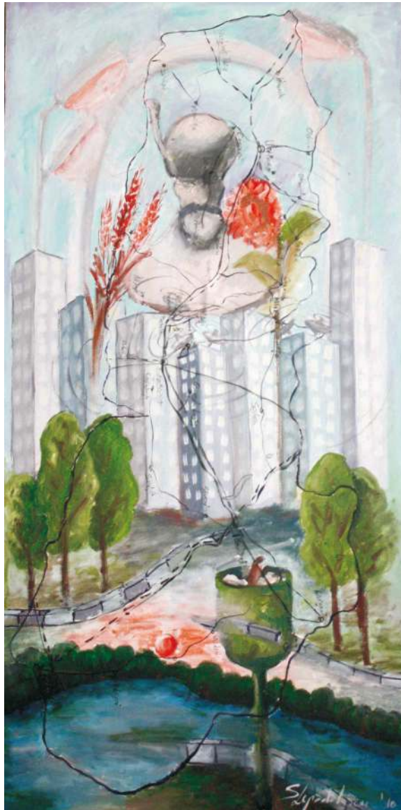
Locul I – LEPĂDĂTESCU SĂFTICA SIMONA, din Slobozia, pentru lucrarea „ Unire ”