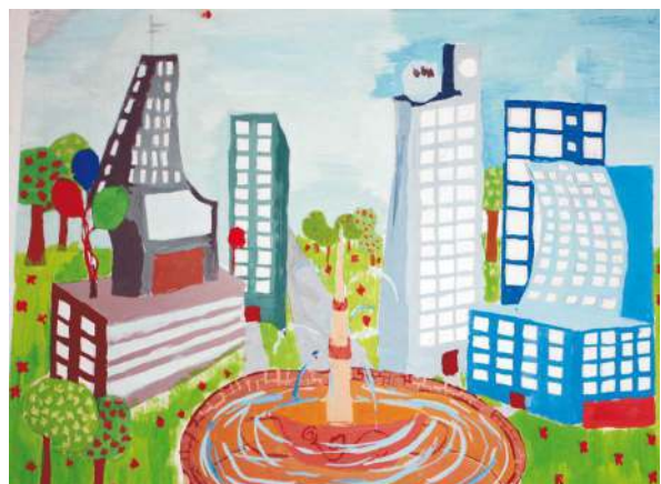
Locul III – GHIȚĂ MĂDĂLINA, de la Liceul de Artă „Ionel Perlea” din Slobozia, pentru lucrarea „ Viiitorul ”