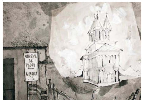
Locul III – GRIGORE FLORIN, din Slobozia, pentru lucrarea „ Vîitorul în trecut! ”